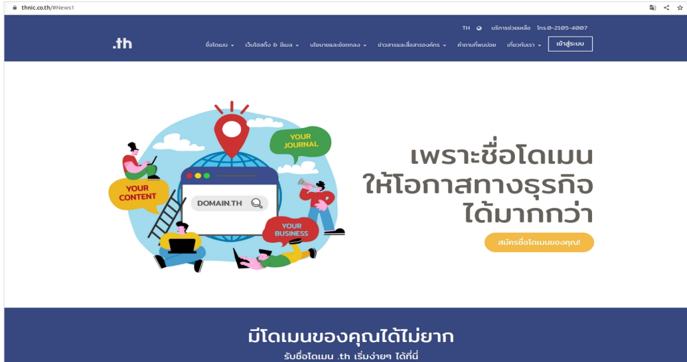
ภาพที่ 1 หน้าจอ เข้าเว็บทีเอชเน็ต