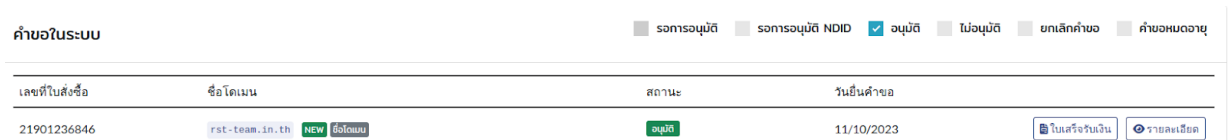
ภาพที่ 3 หน้าจอคำขอในระบบที่ได้รับการอนุมัติ